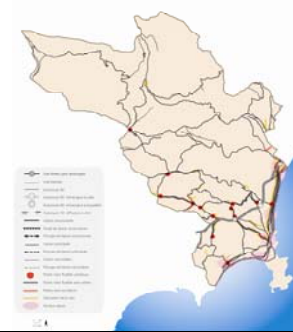
PLAN DE RESORPTION DES POINTS NOIRS ROUTIERS